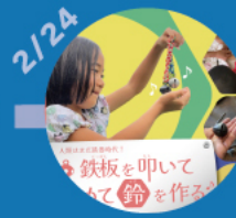
【第5回】 ハサミで鉄を切つて ハンマーで叩いて鈴を作る