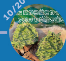
【第3回】 草から縄をなつて アシナカ草履を編む