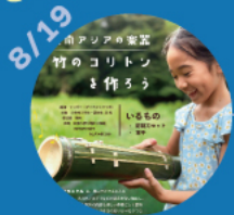
【第1回】 東南アジアの楽器 「竹のコリトン」を作ろう