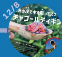
【第4回】 焚き火の炭で木を彫つて スプーンを作る