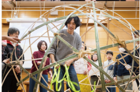
下画像3点