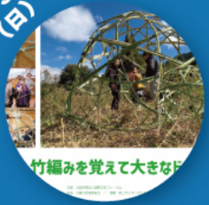
【第6回】 竹編みを覚えて 大きなドームを作る