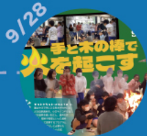
【第2回】 手と木の棒で火を起こす